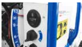
Elektrische, stufenlose Einstellung der Schnitthöhe