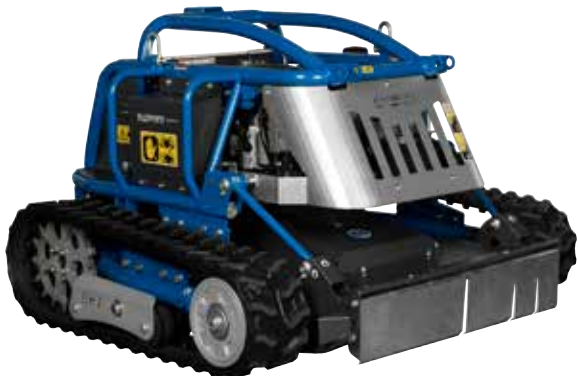
X-ROT 70 EVO