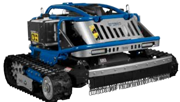
X-ROT 95 EVO