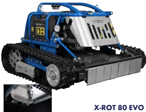
X-ROT 80 EVO