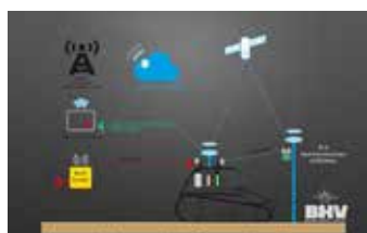
GPS Steuerung - optional