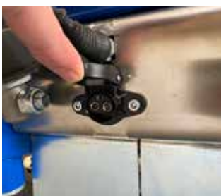
Zusätzliche Steckdose (48V)